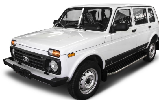
Общий вид автомобиля с порогом