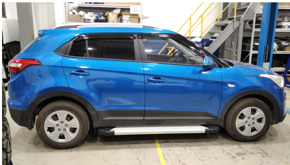
Общий вид автомобиля с порогом

Перед установкой изделия необходимо убедиться, что автомобиль, на который планируется установка, соответствует модельному ряду, указанному в настоящей инструкции. В случае затруднений с определением соответствия обращайтесь службу технической поддержки supp@rivalauto.com . В случае наезда на препятствие необходимо убедиться в отсутствии повреждений и агрегатов автомобиля и пригодности дальнейшей эксплуатации порогов. При правильной установке пороги не должны касаться узлов и агрегатов автомобиля. Производитель вправе вносить изменения в конструкцию порогов.